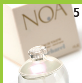
5 Noa, Cacharels bestseller parfume 30 ml. ren, feminin og blomstrende duft.