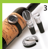
3 Menu vinsæt Vakuumprop Dekanterings- prop Vintermometer Folieskærer