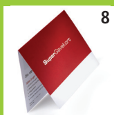
8 Super- gavekort på 200 kr.