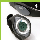
4 Pulsur til måling af min./max. samt gennem- snitlig puls på løbeturen.