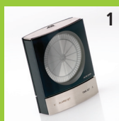
1 Jacob Jensen Timer clock i det kendte, flotte design.

Du kan vælge mellem følgende 9 flotte gaver: