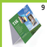
9 Hjælp 2 gadebørn i Honduras via Leve Børnene.