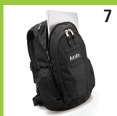
7 High Sierra Laptop rygsæk i høj kvalitet med mange detaljer.