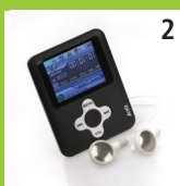
2 MP4 afsplitter i flot design, sort, 2GB.