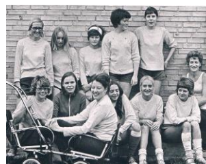
Efter kun 2 år havde HGI Dameafdelingen 80 aktive medlemmer.